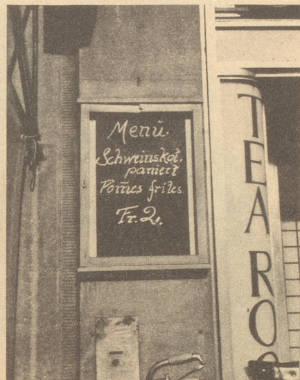
Lieber Nebelspalter, ich aß nicht hier. Dein Eg.