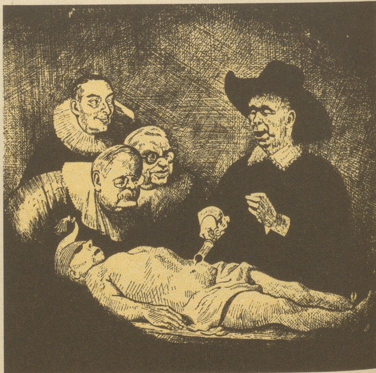
O Serum, Serum, Serum!