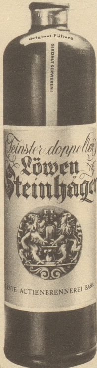
Erste Aktienbrennerei Basel

lieber Leser, beim Genuß einer herrlichen Mahalla-Luxe ist ein beglückendes Erlebnis. Mit frischen Tabaken der neuen Ernte. MAHALLA-CIGARETTEN-FABRIK RICHTERSWIL/ZCH.