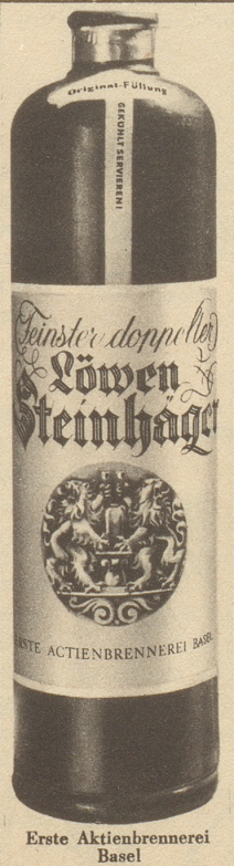
Erste Aktienbrennerei Basel

lieber Leser, beim Genuß einer herrlichen Mahalla-Luxe ist ein beglückendes Erlebnis. Mit frischen Tabaken der neuen Ernte. MAHALLA-CIGARETTEN-FABRIK RICHTERSWIL/ZCH.