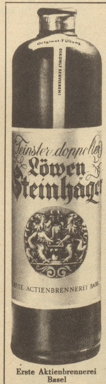
Erste Aktienbrennerei Basel

Veltliner MISANI Du Nord CHUR Tel. (081) 2 27 45