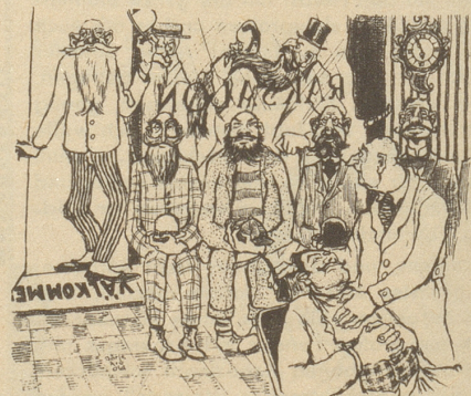
Fünf Minuten vor 6 ... oder der Angsttraum des Barbiers.

Ueber den letzten Akt der Geschichte breitet der Chronist den Mantel der Nächstenliebe. Der Leser kann sich selbst vorstellen, in welcher Weise der weltlinerkundige Signor Rossi die Mühen seiner potentiellen Retter entschädigte und das Gelächter der Kameraden zu löschen versuchen mußte. Peter.