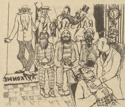
Fünf Minuten vor 6 ... oder der Angsttraum des Barbiers.

Ueber den letzten Akt der Geschichte breitet der Chronist den Mantel der Nächstenliebe. Der Leser kann sich selbst vorstellen, in welcher Weise der weltlinerkundige Signor Rossi die Mühen seiner potentiellen Retter entschädigte und das Gelächter der Kameraden zu löschen versuchen mußte. Peter.