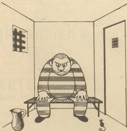
Wer sich behaglich fühlt zu Haus, Der rennt nicht in die Welt hinaus!