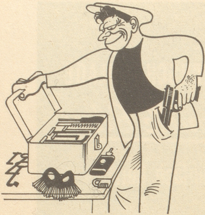
Ein Mann, der recht zu wirken denkt, Muß auf das beste Werkzeug halten.