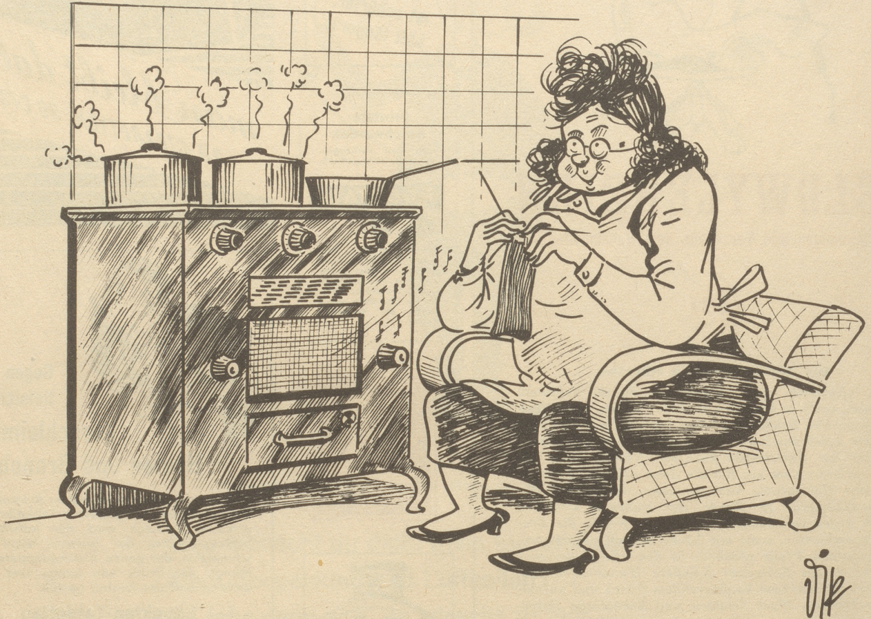
Neuestens wird in Amerika mit Radarstrahlen gekocht.