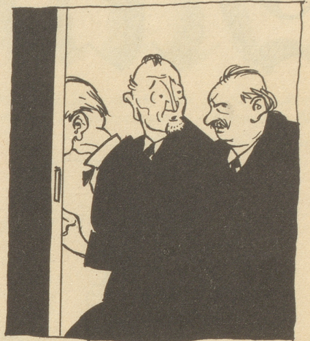
und die Abgeordneten CDE die Flucht!