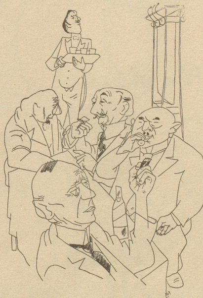
Bei der Abstimmung über das Kriegsächtungsgesetz im nordwürttembergisch-badischen Landtag bekundeten nur 46 von 100 Abgeordneten durch Anwesenheit ihr Interesse.

Es lebe das Velo der guten alten Tradition! V. O. C.