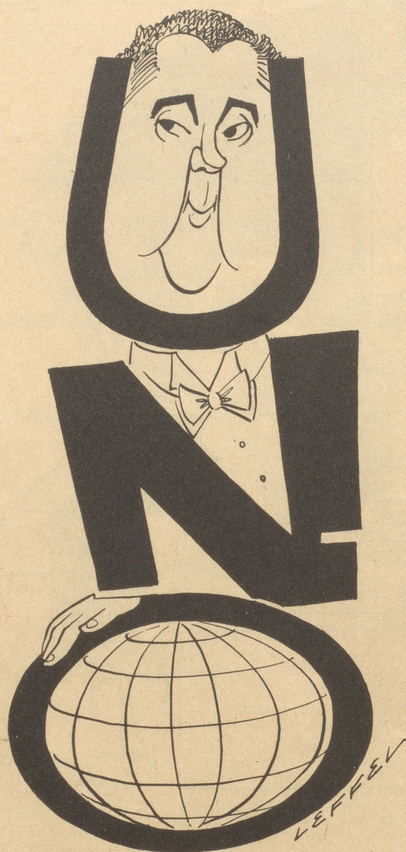
Das Portrait des Tages