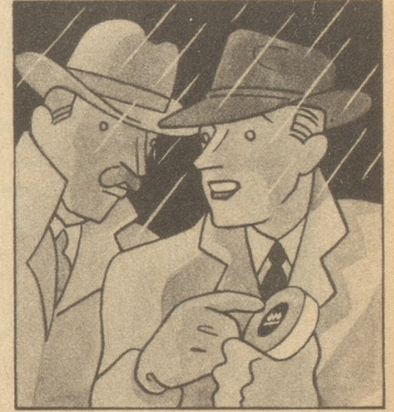
„Der Schirm ist gut, aber mir sind meine Gaba noch wichtiger. Bitte, bedienen Sie sich!“ Ob's windet, regnet oder schneit, Gaba schützt vor Heiserkeit!