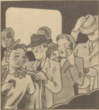
Die Kinobesucher sind noch ganz benommen von allem Gesehenen und von der Hitze im Saal. Draußen geht ein kalter Regen nieder.