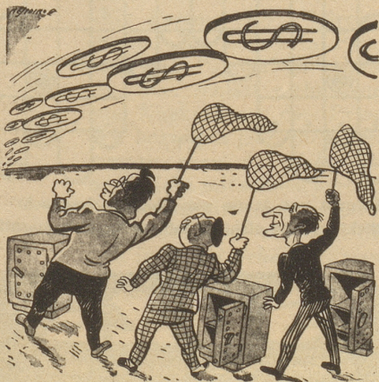
Die fliegenden Teller sind in Italien gesichtet worden.