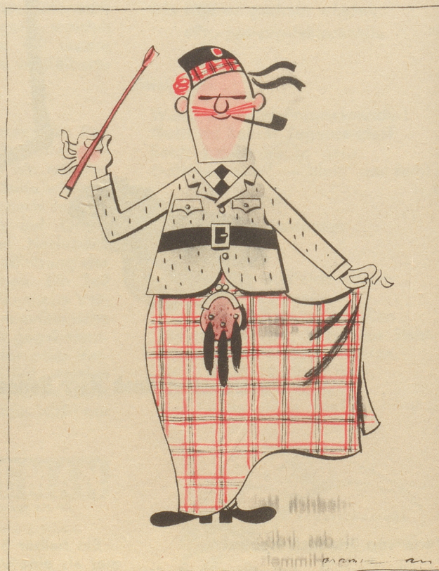
Wird der Schrei der Mode bis nach Schottland dringen?