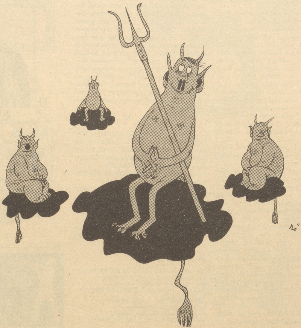
Stalin macht Volksdemokratien