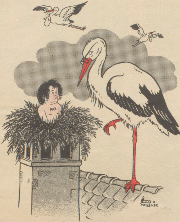
Mich nimmts nur wunder, wie lang ich dich no do bhalte mueß!