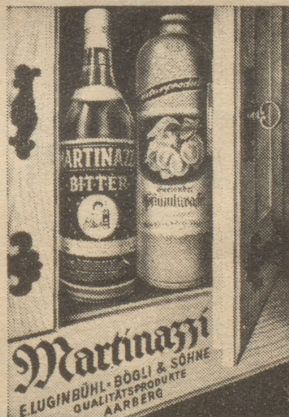
Martinazzi-Bar Mustermesse Basel Halle 14 Stand Nr. 4662