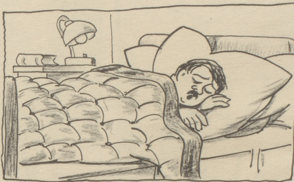
Gar viele fun das leider nicht, obschon es eine Bürgerpflicht.