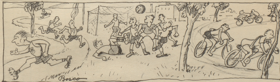
Die Jugend aber sportelt froh. Sie heiligt den Sonntag so. In jeder Stadt, in jedem Nest ist Sonntag und ein Muskelfest.