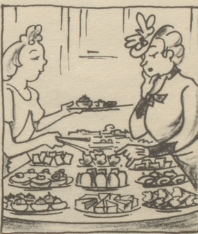
Nachdem die Predigt ist vorbei geht man in die Conditorei und kauft dort als ein braver Christ sich Stückli, weil es Sonntag ist.