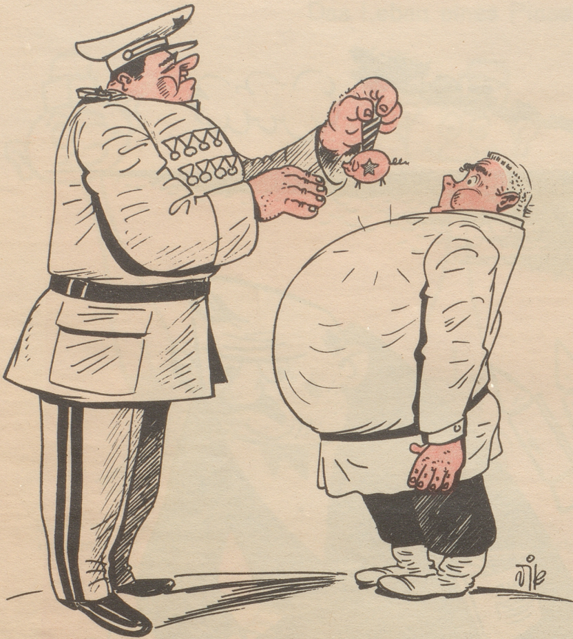
Sowjet-Rußland verleiht Orden an Personen, die sich um die Steigerung des Viehbestandes verdient machen.

Genosse, unsere Alma mater Reicht Dir den roten Ferkelorden, Schon wieder ist Dein Eber Vater Und Deine Sau Mama geworden!