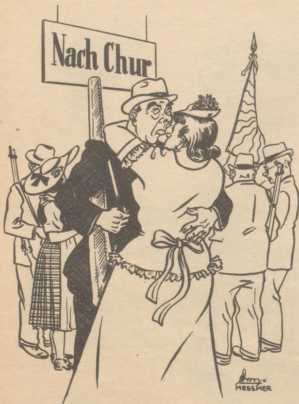
Gäll Guschti schüssescht nid mit andere Maitli umenand!