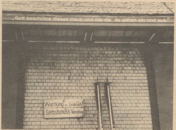
Gott und die Selbstschuss-Vorrichtung