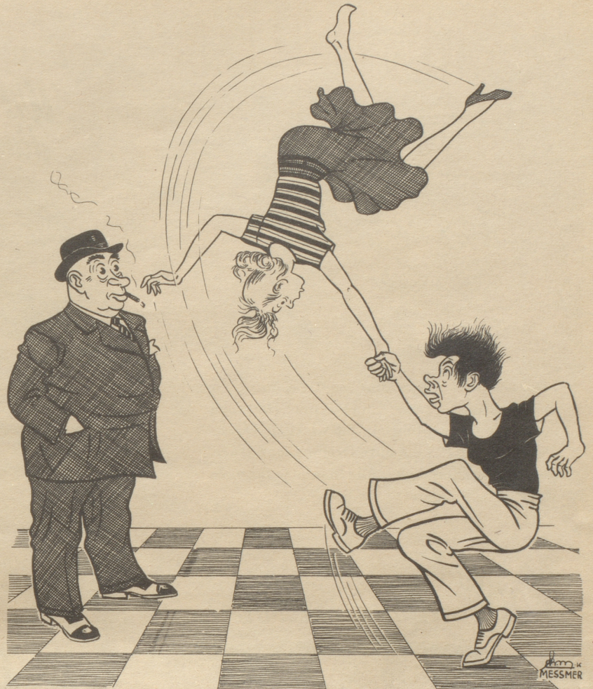
Jiu-Jitsu? Nei, Be-bop!

So knüpfte ich denn in Basel beim Verlassen des Bahnhofs meinen Regenmantel zu und klemmte unter den Arm meine Mappe, worin ich Nachthemd, Zahnbürste und Rasierpinsel verpackt hatte. Denn schließlich wollte ich den unbekanntem Onkel gleich einige Tage genießen, zumal er mich wiederholt brieflich zu einem Besuche eingeladen hatte. — Nachdem ich ihm also endlich meine Visite angemeldet hatte, stand ich nun glücklich vor dem Haus, worin er laut Angaben wohnen mußte. Wirklich, es fand sich da unter mehreren Täfelchen eines mit seinem Namen. So stieg ich denn in den dritten Stock hinauf, wo sich eine halbgeöffnete Türe