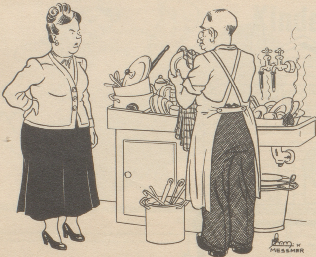
„Du chöntisch au e chli pressiere, du weisch jo, daß d'am zweu im Büro muesch siil“