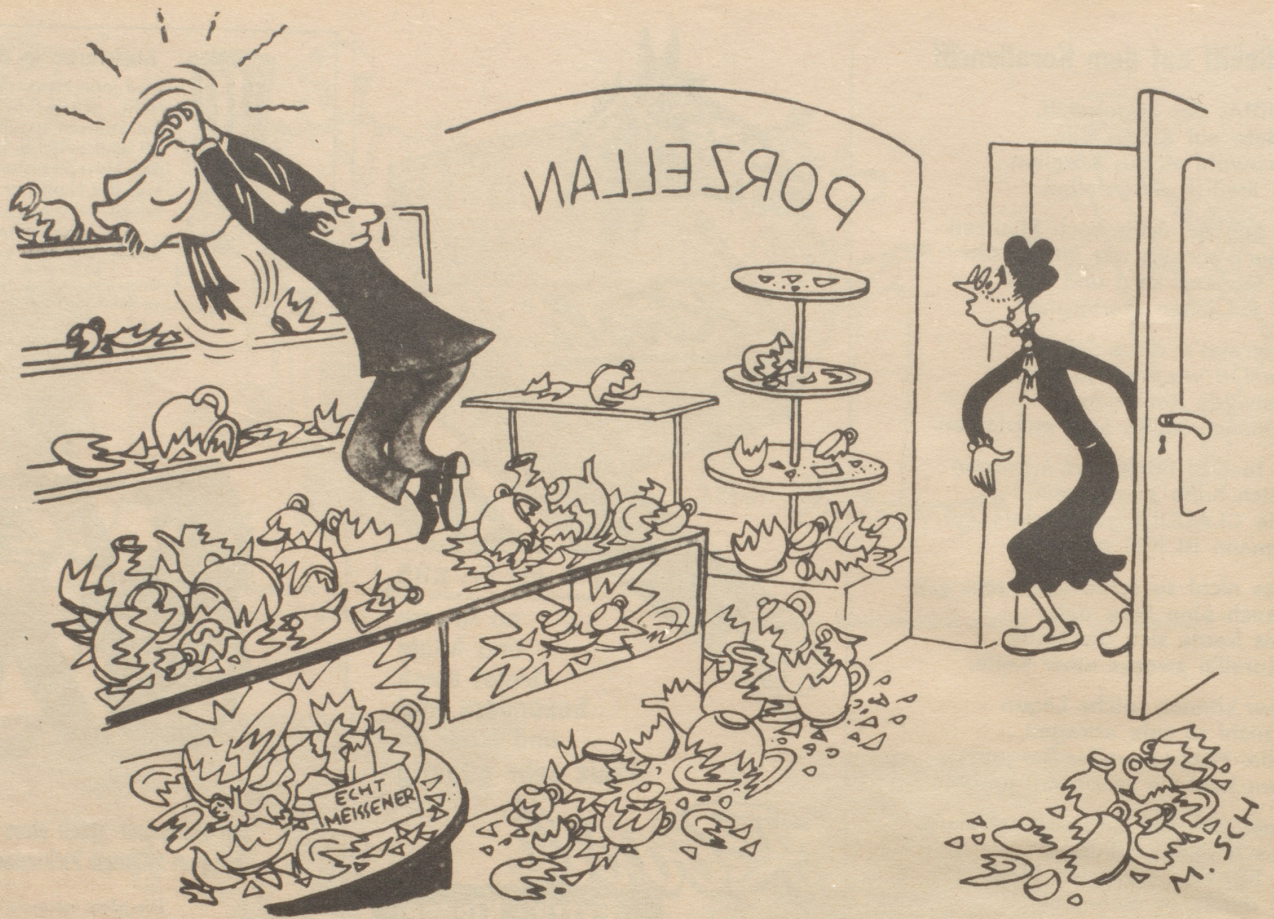
„Herr Chrüsi isch vilicht min Papegei bi Ihne?“