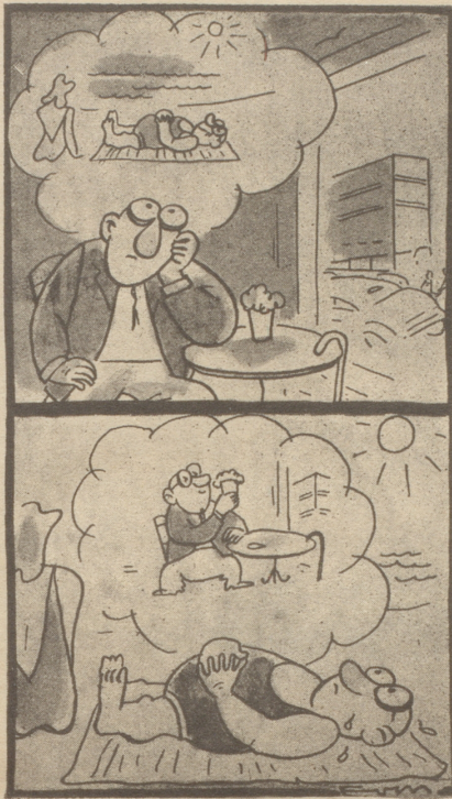
Der Unzufriedene Tyrihans