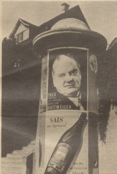
Les extrêmes se touchent