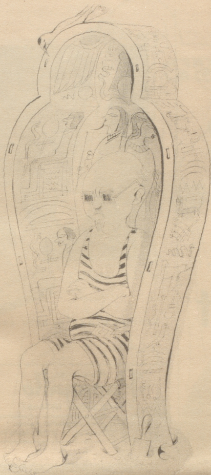
Der Strandkorb des Ägyptologen