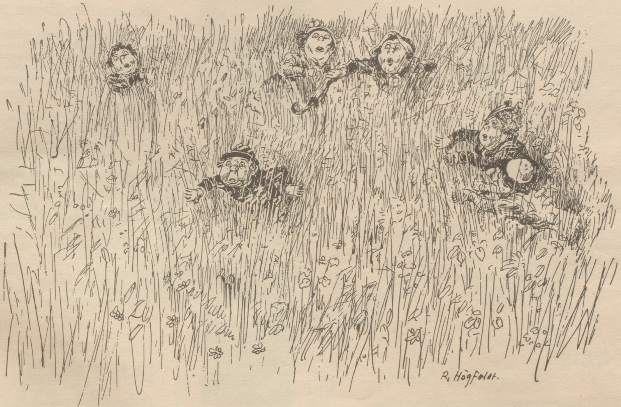
Paris, von Göttinnen verfolgt