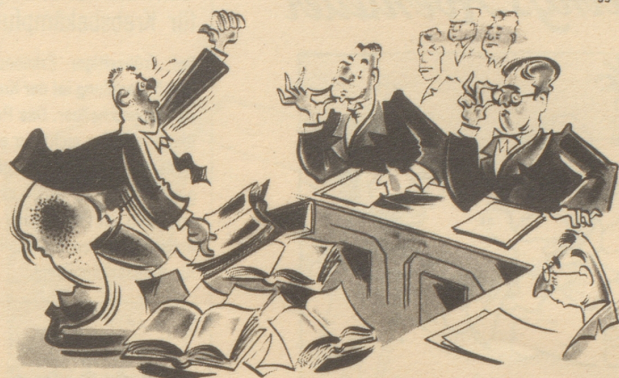
Als debiler Psychopath, notorischer Säufer, ärztlich beglaubigter Hypochonder, asozial und mit verminderter Zurechnungsfähigkeit habe ich nach den Gesetzen und diversen Gutachten das klare Recht auf Minimalstrafe mit bedingtem Straferlaß!