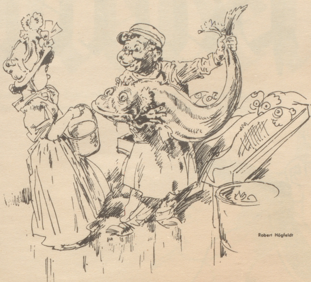
«Nämezi dä Frölain».