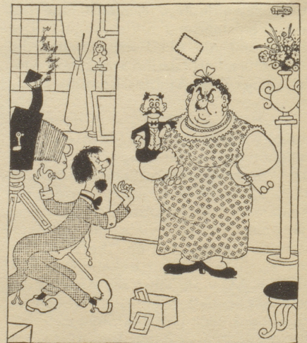
„... und von meinem Mann machen Sie eine Vergrößerung!“ Dubou in „Der Simpl“

Niemals darf Euch imponieren Uebertüchtigs Schwadronieren, Höret auf ihr Großtun nicht, — Tuet einfach Eure Pflicht! Pölschterli