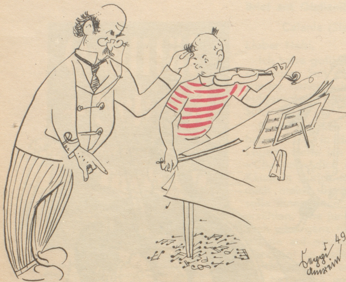
„Mit dene Note wot nid schpilsch, chöntme es neus Schtück komponiere!“