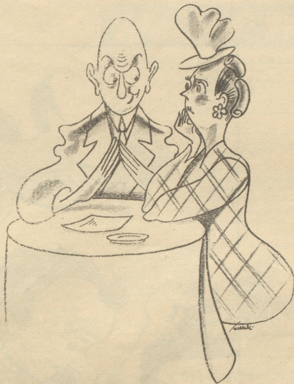
„Unglaublich, daß Hans mit Deiner Frau durchgebrannt ist; er war doch Dein bester Freund?“ „Das war er nicht, aber jetzt ist er es.“ Tyrihans