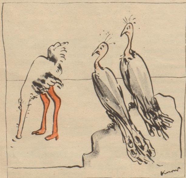
„Was bleibt ihr anderes übrig, wenn sie soo unmodern geht.“