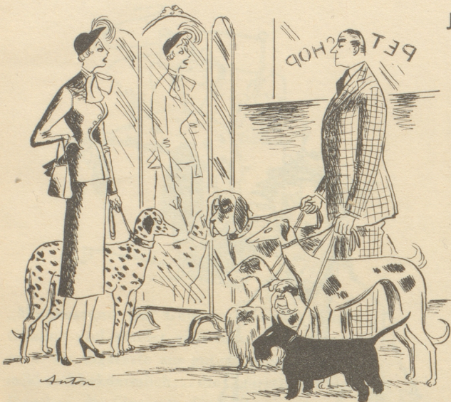
«Aber vielleicht paßt doch der Rotbraune besser zu meinem Kleid!»