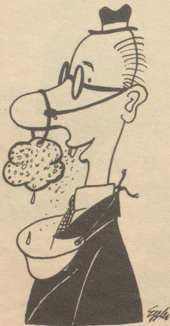
in Fälln von feuchter Aussprache