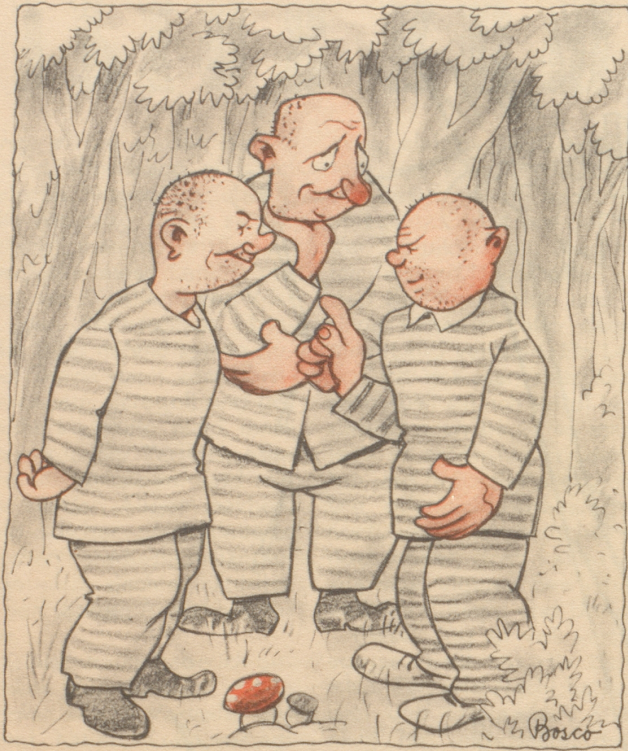
En Augenblick, es chunnt na ein und dänn gründet mir en Verein!