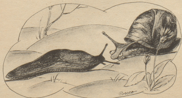
„Hänzi immer no kei Wohnig, Frau Schnäderischnäg?”

Arbon, Basel, Baden, Chur, Frauenfeld, St. Gallen, Glarus, Herisau, Lenzburg, Luzern, Olten, Oerlikon, Romanshorn, Rüti, Schaffhausen, Stans, Winterthur, Wohlen, Zug, Zürich. Depots Schild AG in Bern, Biel, La Chaux-de-Fonds, Interlaken, Thun, Sion, Montreux