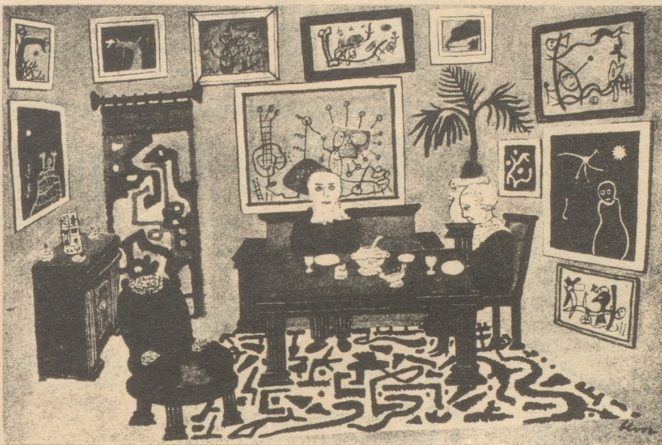
«Das alles erinnert mich genau an meiner Mutter Makkaronipudding.»