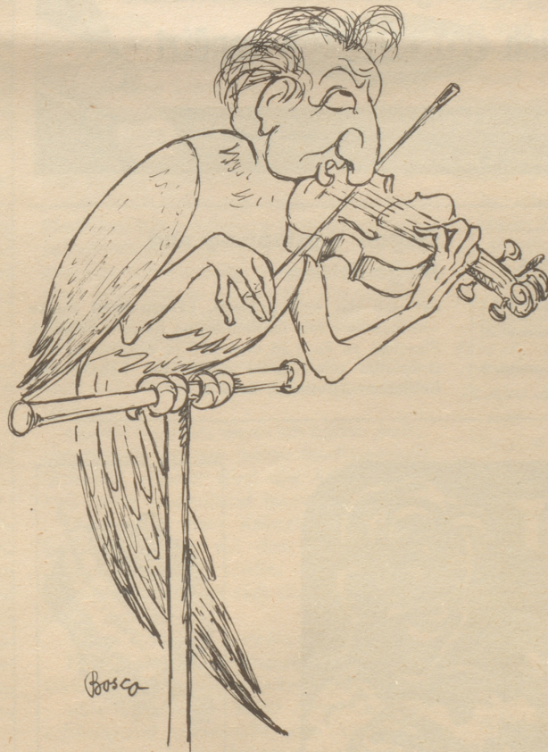
Kreuzung zwischen einem Papagei und einem Violinspieler: Der Papageiger