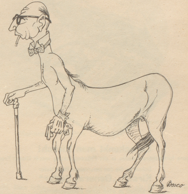
Kreuzung zwischen einem Seepferd und einem Nilpferd: Das Senilpferd