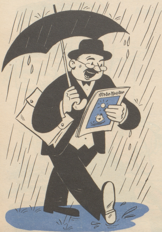
Der Nebelspalter verscheucht Sorgen