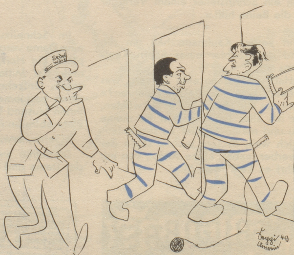
Gruß aus der Anstalt Sedel „Chumm mir gönd go sägele!“

Druck: Buch- und Offsetdruckerei E. Löpfe-Benz in Rorschach