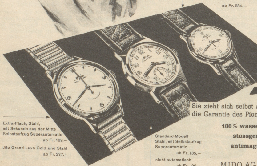
Damenuhr, Stahl mit Sekunde aus der Mitte und Selbstaufzug Superautomatic ab Fr. 173.— dito Grand Luxe Gold und Stahl ab Fr. 284.—

In härtester Praxis bewährt hat sich die Pioniermarke