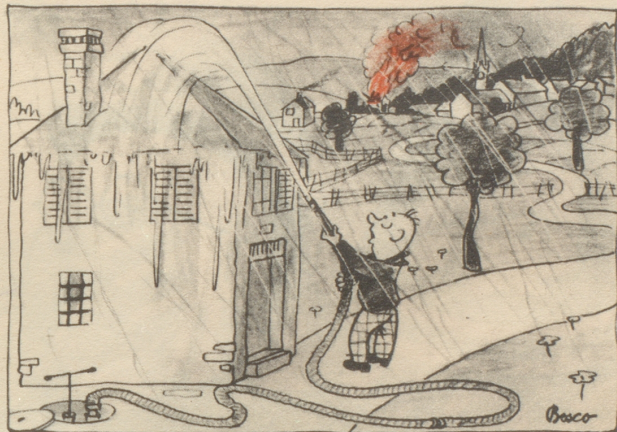
Der Opti- und der Pessi-mischt