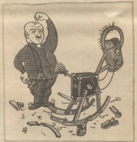
Die Axt im Haus erspart das Chrischindli

Was willst du mehr? hüben wie drüben wirst du stark gefeiert, und wenn dir das trotz deines hohen Alters zu anstrengend wird, so nimm deinen Divan und ruhe sanft auf beiden Seiten.»