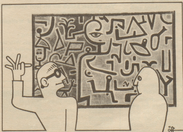
„...?“ „Klee! — ...ptomantie??“

Elster, 11 Rheuma, 12 Schizo(phrenie), 13 U.V., 14 Sand, 15 Helen, 16 nai, 17 wo, 18 Na, 19 nre = Ern(st), 20 A.D., 21 s.v., 22 no, 23 Reis, 24 Tosga, 25 Ernest, 26 Dr. X, Arzt, 27 naiv, 28 (T)antalu(s), 29 Eimer, 30 Ende, 31 Euboea, 32 Dorf, 33 gerne, 34 Du, 35 Dr., 36 ls.