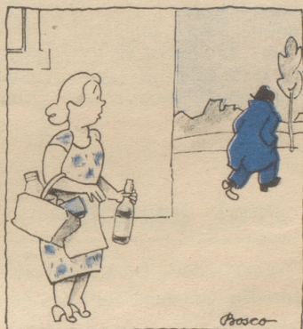
Da verzweifelte der Mann an der heutigen Welt!

Sie gibt es in jedem Dorf und jeder Stadt und jedem Land.