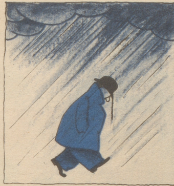
Es war einmal ein Mann, der ging bei strömendem Regen ohne Schirm am Bundeshaus in Bern vorbei.

Sie kennen diese Herren übrigens auch. Jeder kennt sie.