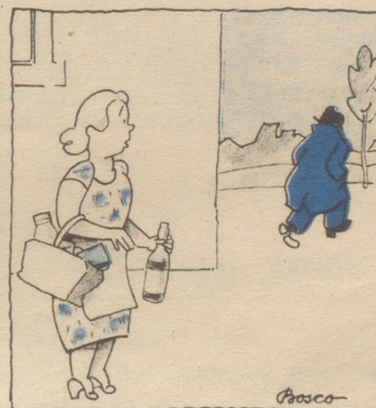
Da verzweifelte der Mann an der heutigen Welt!

Sie gibt es in jedem Dorf und jeder Stadt und jedem Land.