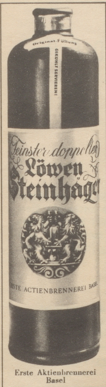
Erste Aktienbrennerei Basel